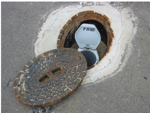
Im Zuge der DU errichtete Messstelle

Status: Grundwassermonitoring 2015 abgeschlossen