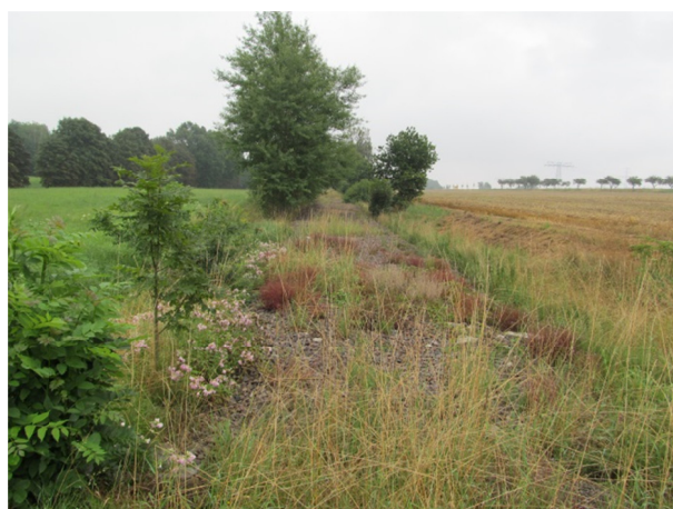
Ortsbegehung mit Erfassung des aktuellen Zustands